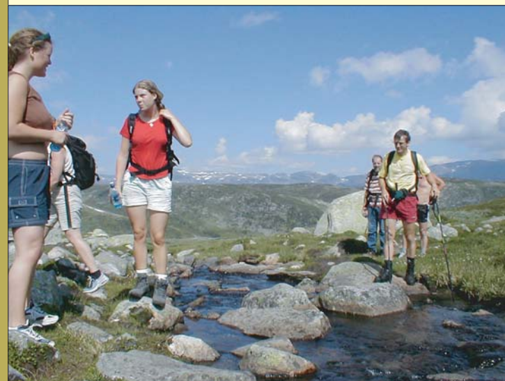
Turgåere på vei til Lordehytta

Det går merket sti fra fylkesveg 50 opp til toppen av Hivjufossen (på østsida av elva). OBS. Følg oppmerket sti og gå ikke for nær fossene. Be careful, keep on the marked track and don't go near the waterfalls.