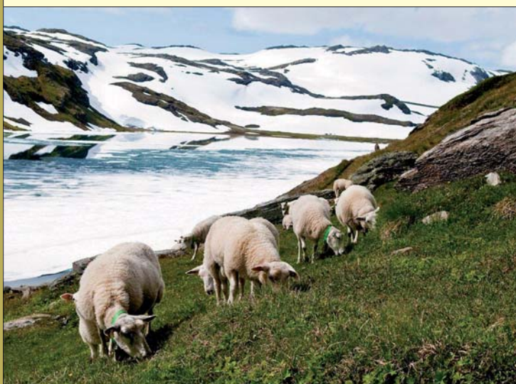
Hallingskarvet, sauer på vårbeite

Hallingskarvet mountain area is among the biggest continuous alpine plateaus in Europe, with summits up to 1933 metres above sea level. The plateau is 35 km long and up to 5 km wide. Apart from the dramatic landscape element, there are fertile hill sides and valleys around the whole mountain with several vegetation types and biotopes. Hallingskarvet offers innumerable possibilities for hiking and several huts just outside the national park are open to all visitors. The purpose of designating the Hallingskarvet area as a national park is to conserve a large connected and practically untouched mountain area.